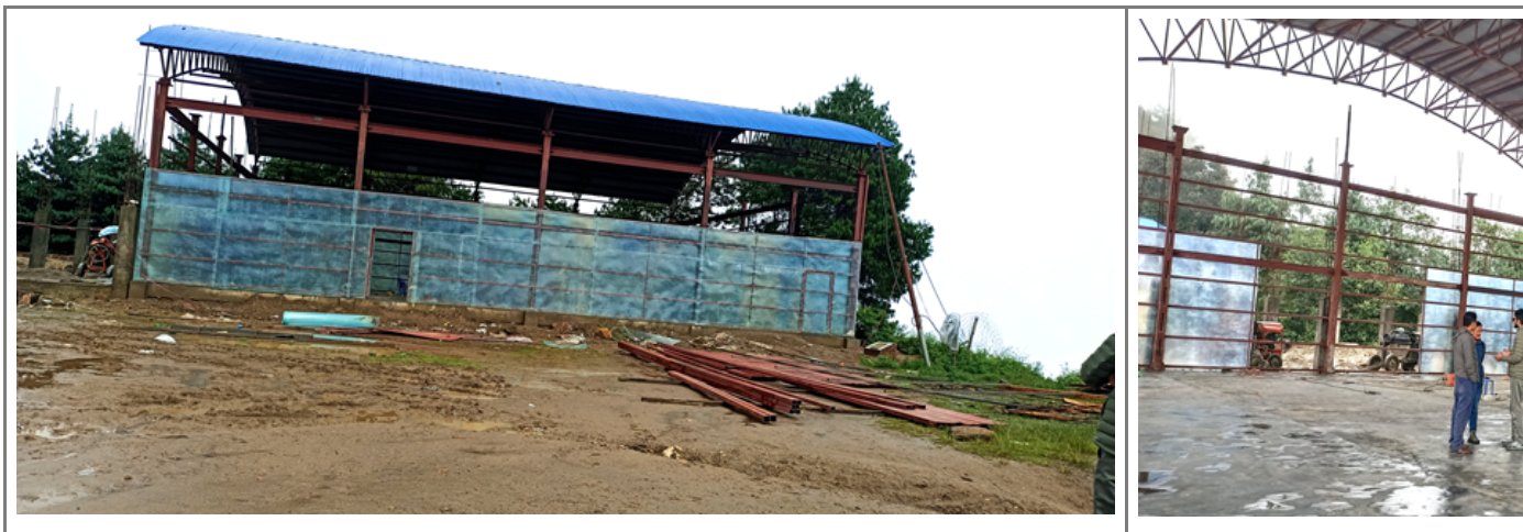
निर्माणाधिन अधुरो सभाहल

स्थलगत अवलोकन – निर्माण व्यवसायीले सम्झौता गरी निर्माणको लागि जिम्मा लिएको काम पेश गरेको कार्यतालिका अनुसार गर्नुपर्दछ । लेखापरीक्षणका क्रममा निर्माणाधिन सभाहलको कार्यालयका सम्बद्ध पदाधिकारी तथा लेखापरीक्षण टोलीबाट संयुक्त रुपमा स्थलगत अवलोकन गरीयो । अलवलोकनको क्रममा सभाहल निर्माण गरेपनि स्टेज नवनाएको, ट्रसको लागि कालो फलामे पाईप जोड्ने काम बाँकी रहेको, नापी कितावमा फाईवर सिट जोड्ने कामको अधिकाँश नापी गरी ११.१५ बर्ग मिटर बाँकी देखाएकोमा आधा भन्दा बढी राख्न बाँकी देखिएको, Steel reinforcement bar of Fe 415/500 grade including supplying, straightening, cleaning, cutting, bending, placing in position and binding को काम करीव ०।६१ टन परिमाणको काम बाँकी रहेको, नापी किताव अनुसार पिसिसि पनिङ कार्य बाँकी रहनुका साथै भित्रि भाग खुल्ला रहेको पाईयो । निर्माण व्यवसायीलाई सम्झौता अनुसार काम समयमै सम्पन्न गर्न लागउने तर्फ पालिकाको ध्यान जानुपर्दछ ।