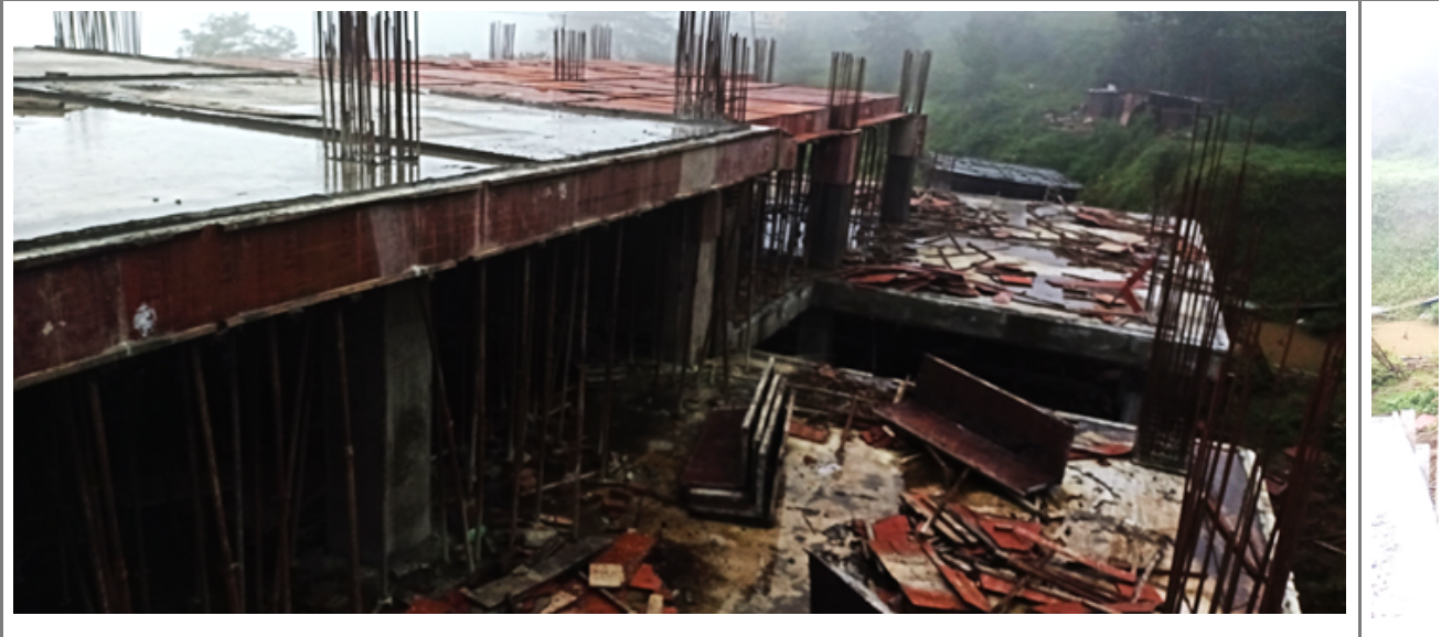
निर्माणाधिन भवनको दोस्रो तलाको ढलानको आधि भाग फर्मा मात्र राखेको र साईट बाट पहिरो खस्ने अवस्थामा रहेको अवस्था